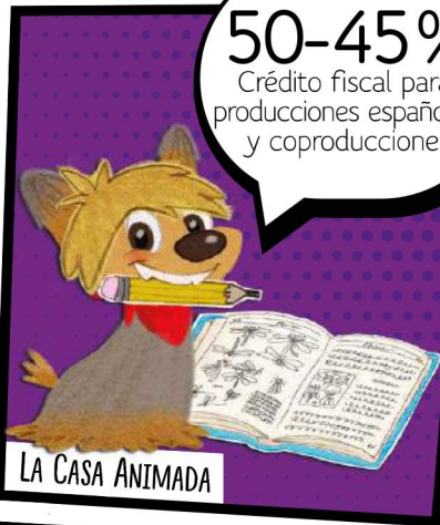
LA CASA ANIMADA